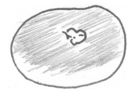
名物・鴨川あんぱん