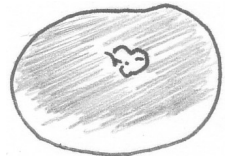
名物・鴨川あんぱん